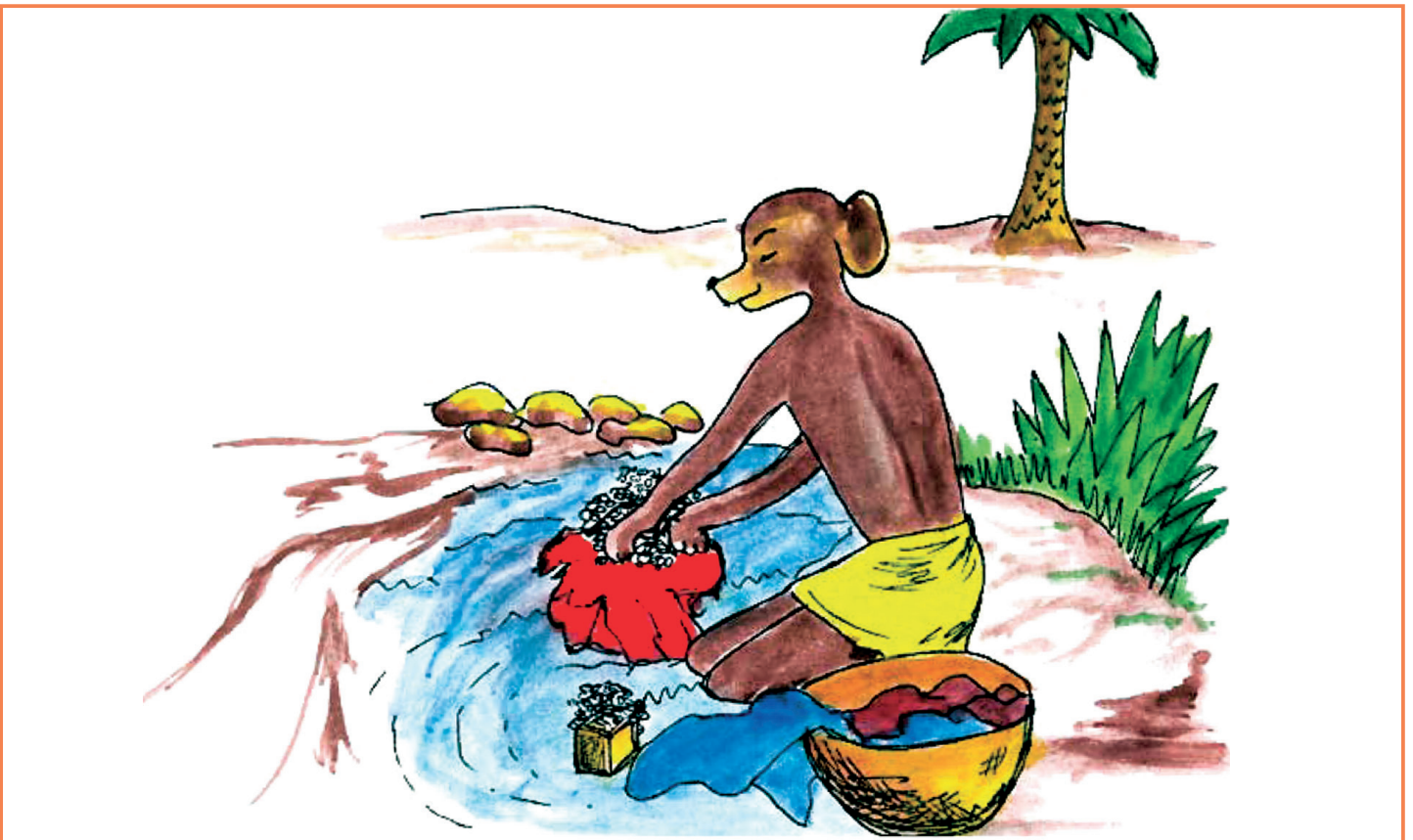
7 Ye keen a faafna.