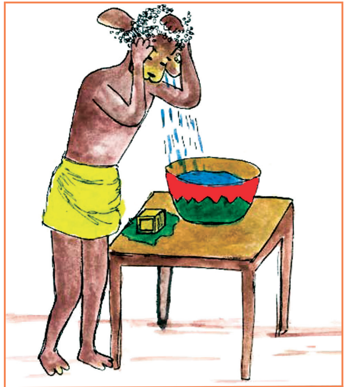
6 Ta bog xoox le, nof ke fo tagid fee.